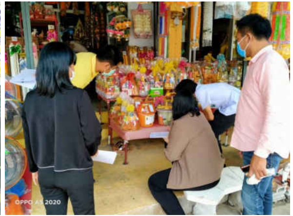
รูปภาพประกอบการลงพื้นที่