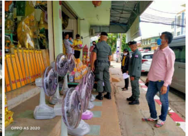
รูปภาพประกอบการลงพื้นที่