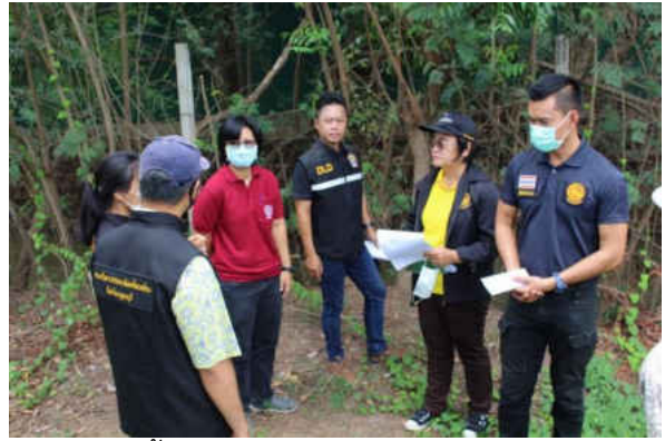
รูปภาพประกอบการลงพื้นที่