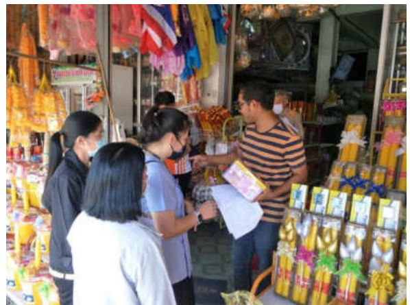
รูปภาพประกอบการลงพื้นที่