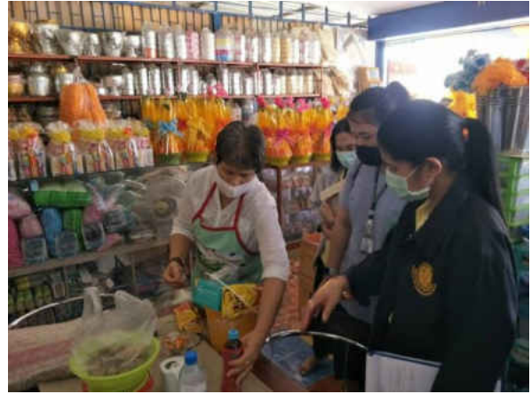
รูปภาพประกอบการลงพื้นที่