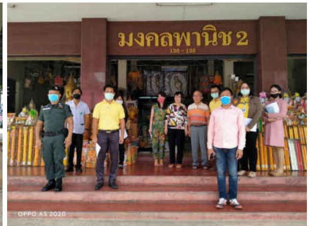
รูปภาพประกอบการลงพื้นที่