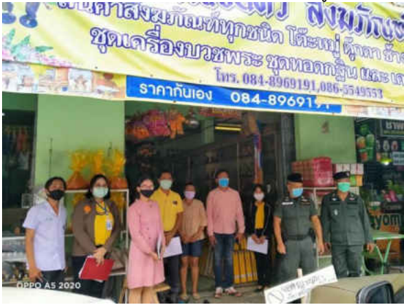
รูปภาพประกอบการลงพื้นที่