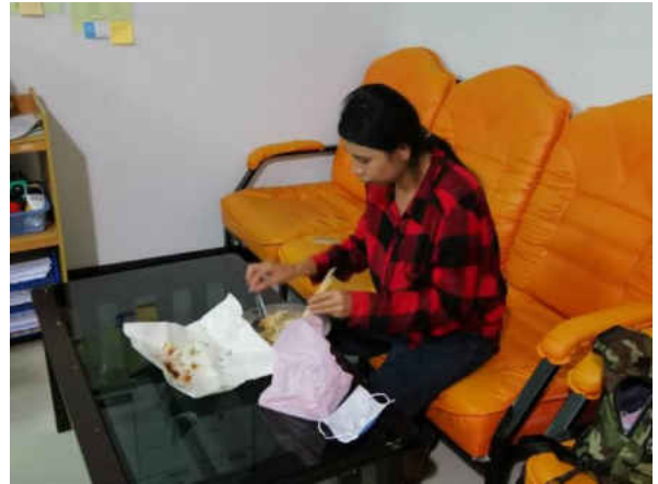
รูปภาพประกอบ