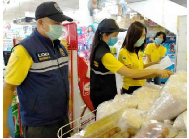
รูปภาพการลงพื้นที่