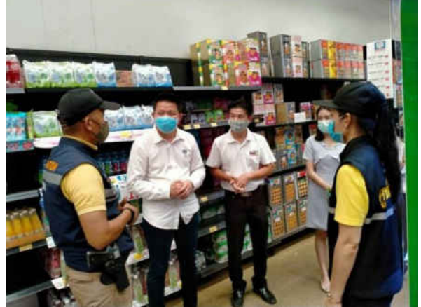
รูปภาพการลงพื้นที่