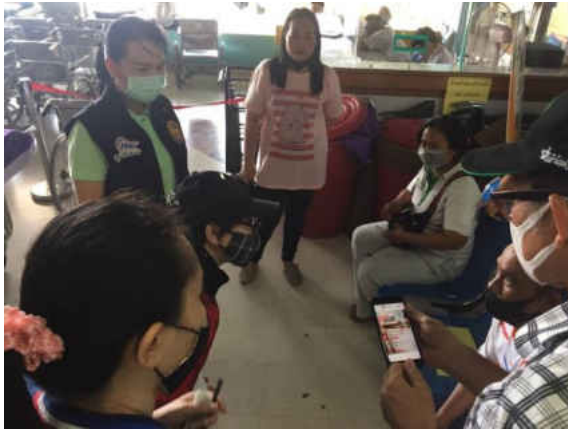
รูปภาพการลงพื้นที่