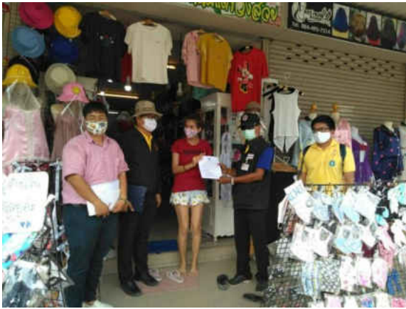
รูปภาพการลงพื้นที่