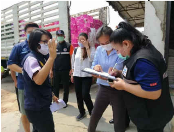
รูปภาพการลงพื้นที่