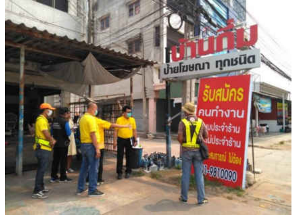
รูปภาพการลงตรวจสอบ